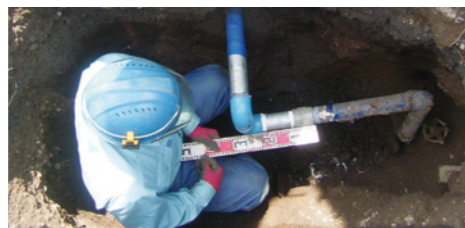
水道管・漏水工事の土木チーム

ビル、マンション、学校、公共・商業施設等での水道工事・空調設備工事・換気設備工事・消火設備工事・衛生設備工事などを実務で修行