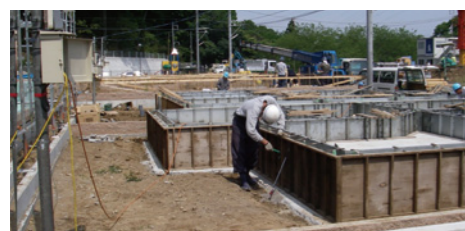
新築・リフォーム工事の木造チーム

道路やお客様宅内での漏水工事・水道設備工事・舗装工事や宅地造成地などでの上下水道工事を実務で修行