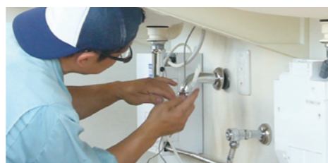
設備メンテナンスチーム

建売、注文住宅での新築工事に伴う、水道工事・設備工事や一般家庭、会社、公共・商業施設等でのリフォーム工事を実務で修行