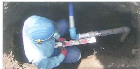
水道管・漏水工事の土木チーム

ビル、マンション、学校、公共・商業施設等での水道工事・空調設備工事・換気設備工事・消火設備工事・衛生設備工事などを実務で修行