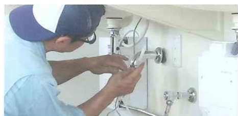
設備メンテナンスチーム

建売、注文住宅での新築工事に伴う、水道工事・設備工事や一般家庭、会社、公共・商業施設等でのリフォーム工事を実務で修行