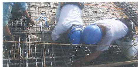
大型物件の耐火住宅チーム

子供のときは夢がたくさんありました。 しかし、大人になるにつれて現実を理解し、夢をあきらめてしまった事はないですか？ 当社は、できるかできないかではなく、やるかやらないかの「気持ち」を大切にしています。 あきらめずに一緒にチャレンジしましょう！