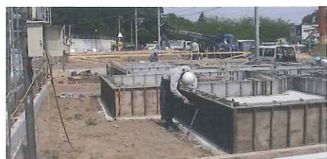
新築・リフォーム工事の木造チーム

道路やお客様宅内での漏水工事・水道設備工事・舗装工事や宅地造成地などでの上下水道工事を実務で修行